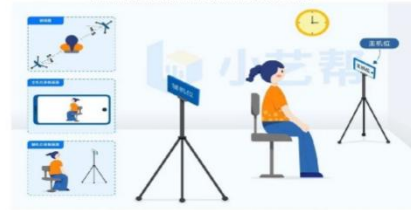
专业/科目考试双机位摆放示意图(坐姿-侧面)