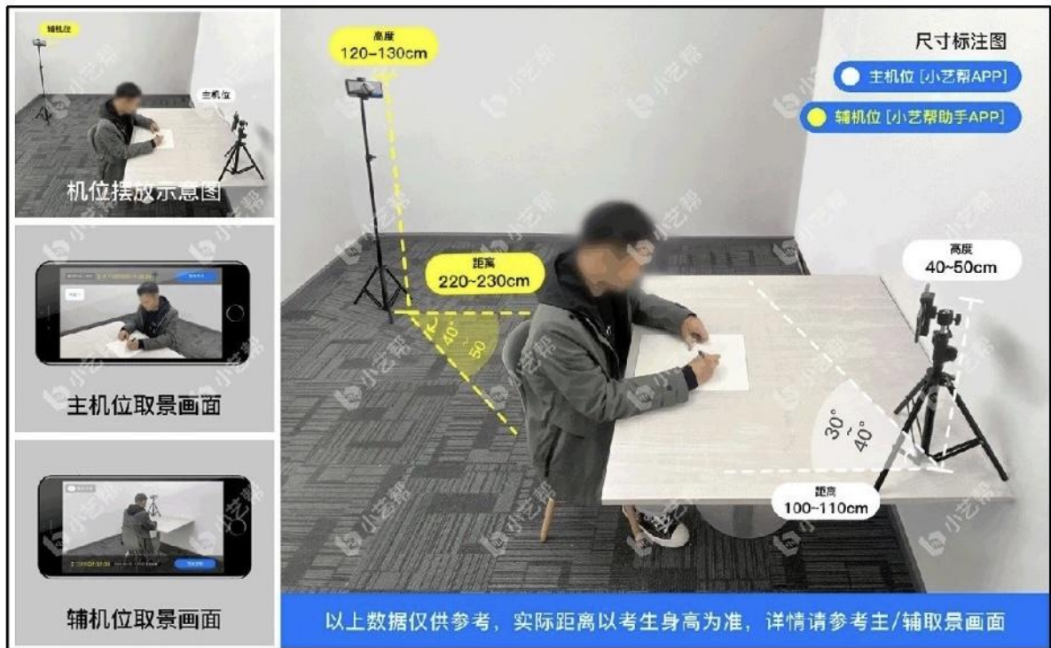
笔试双机位摆放示意图